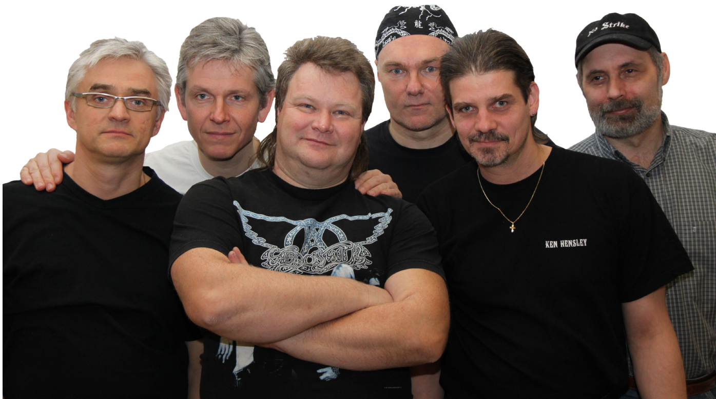
- Die Band No Strike -